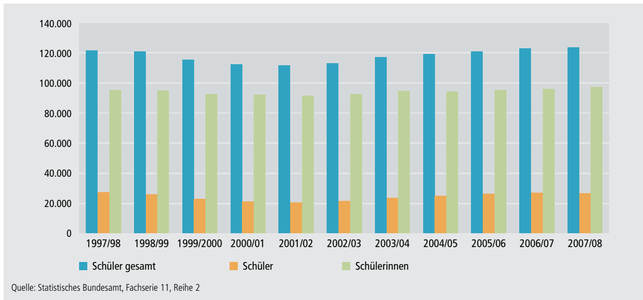
Schaubild A6.3-1: Anzahl der Schüler/-innen an Schulen des Gesundheitswesens nach Geschlecht im Zeitvergleich (1997/1998–2007/2008)

gang 2004/2005 (71.587) seither stetig bis auf nunmehr 65.380 im Schuljahrgang 2007/2008 gesunken → Schaubild A6.3-2 . An den BFS und Fachschulen der Länder im Bereich der Ausbildung zu Gesundheitsfachberufen ist aufgrund der geschlechtsspezifischen Berufswahl die Schiefe zwischen Männern und Frauen sogar noch etwas stärker ausgeprägt als an den Schulen des Gesundheitswesens. Unter den Schülern befanden sich im Jahrgang 2007/2008 lediglich rund 19% Jungen und junge Männer.